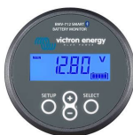
Sensor Bluetooth: Monitor de baterías BMV-712 Smart o SmartShunt