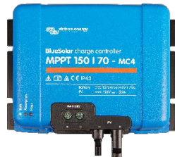
Controlador de carga solar MPPT 150/70-MC4