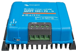
Controlador de carga solar MPPT 150/70-Tr