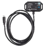
VE.Direct Bluetooth Smart Dongle